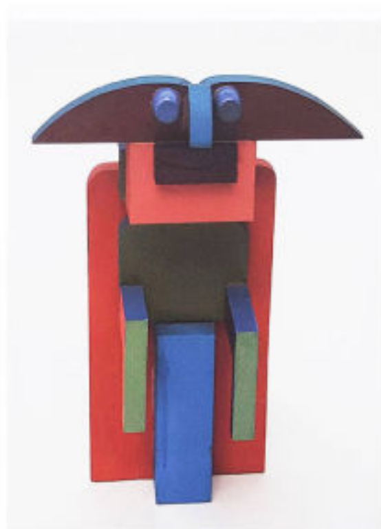
Pierre Caille, Sans titre , s.d., bois polychrome. Don de l'ASBL Pierre Caille.